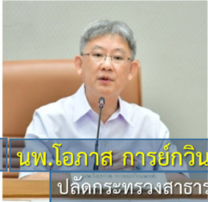
นพ.โอภาส การย์กวินพงศ์ ปลัดกระทรวงสาธารณสุข